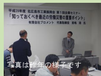
写真は昨年の様子です